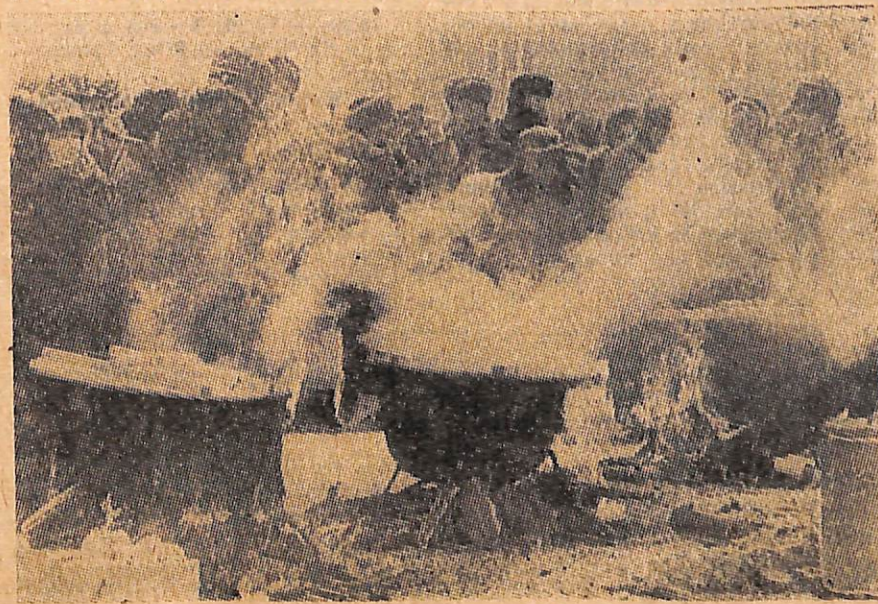
Проводы русской зимы.